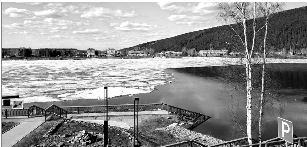
Лена срывает ледяной панцирь

Методика прогнозирования у Иркутской гидрометеослужбы идёт на ближайшие три дня. За этот период подготовиться основательно к большой воде нереально, поэтому работа должна вестись заблаговременно. Заместитель начальника областного управления МЧС обратил внимание участников заседания на задачи, которые предстоит решить в оставшееся до вскрытия рек время. И в первую очередь это оповещение, информирование населения о текущей гидрологической обстановке, о принимаемых мерах. Сейчас уже проведена тренировка по оповещению местного населения с помощью СМС-сообщений. Многих жителей волнует вопрос работы связи во вре-